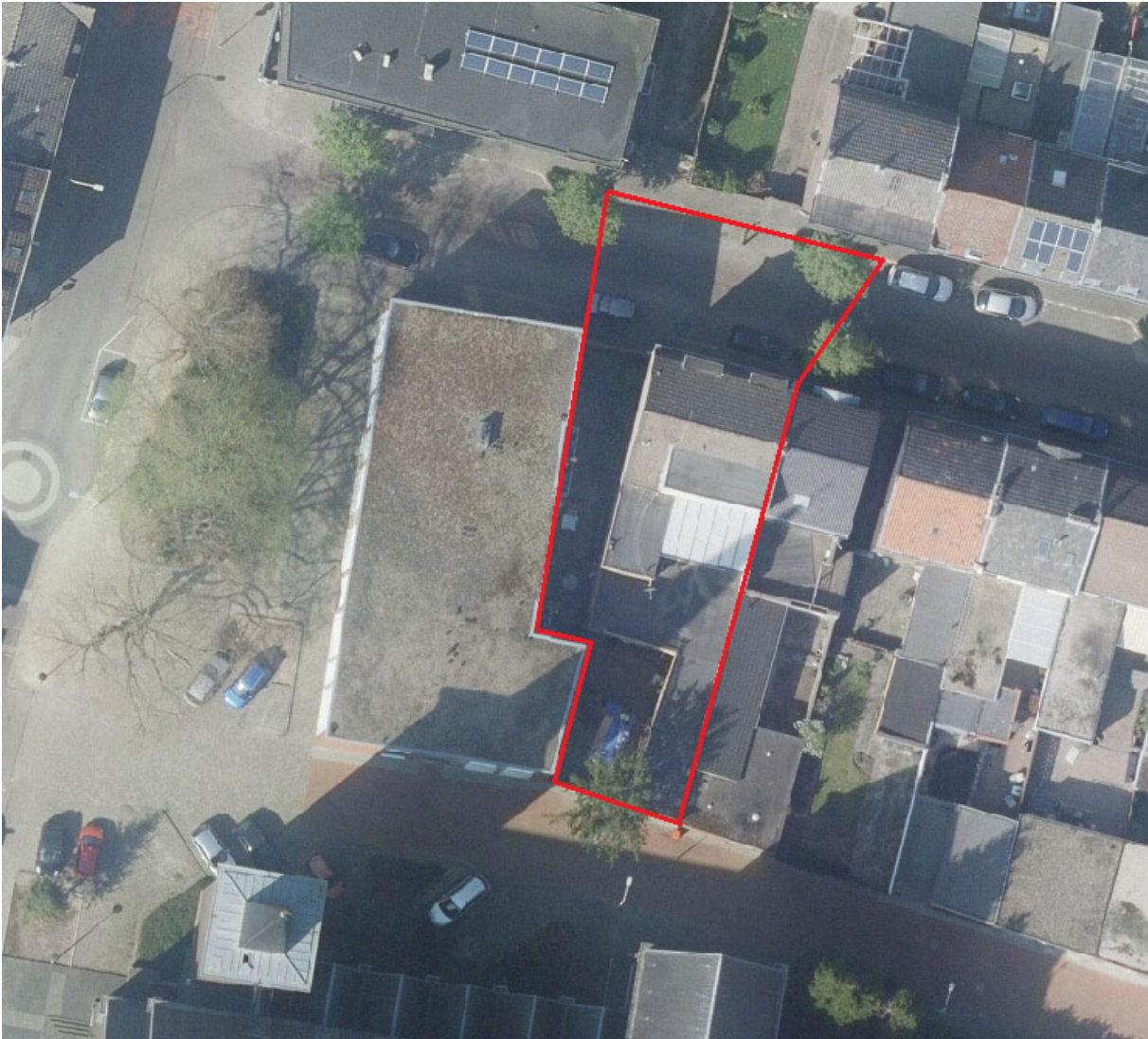
BIJLAGE 1: gebied waarop deze noodverordening van toepassing is.